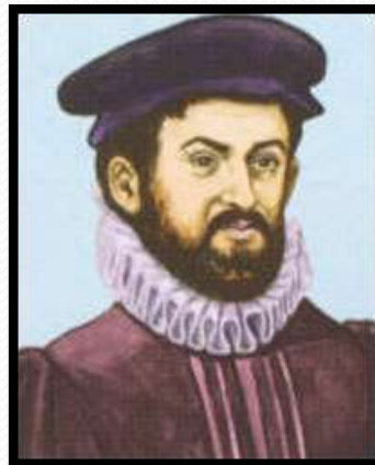
Casiodoro de Reina